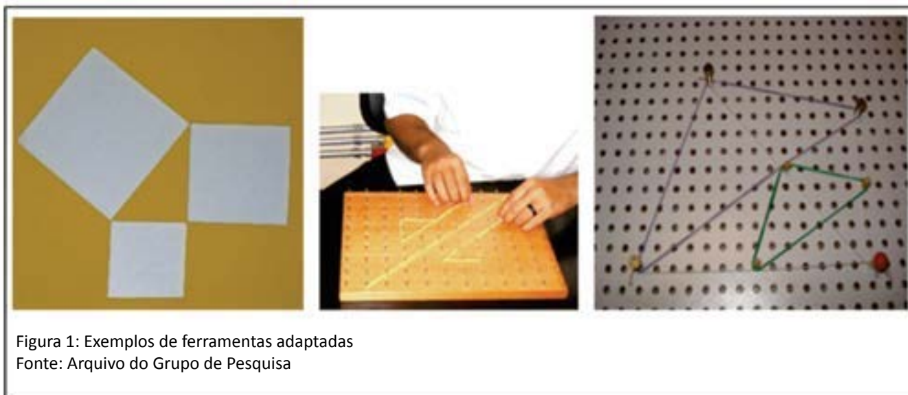
Figura 1: Exemplos de ferramentas adaptadas

especiais, ou seja, os primeiros passos foram dados na direção do que já era conhecido para aqueles considerados “dentro dos padrões normais”. Por um lado, esse procedimento oferecia certa segurança, pois, de algum modo, acreditávamos ter algum controle sobre o que iria acontecer; mas, por outro lado, provocou uma série de questionamentos.