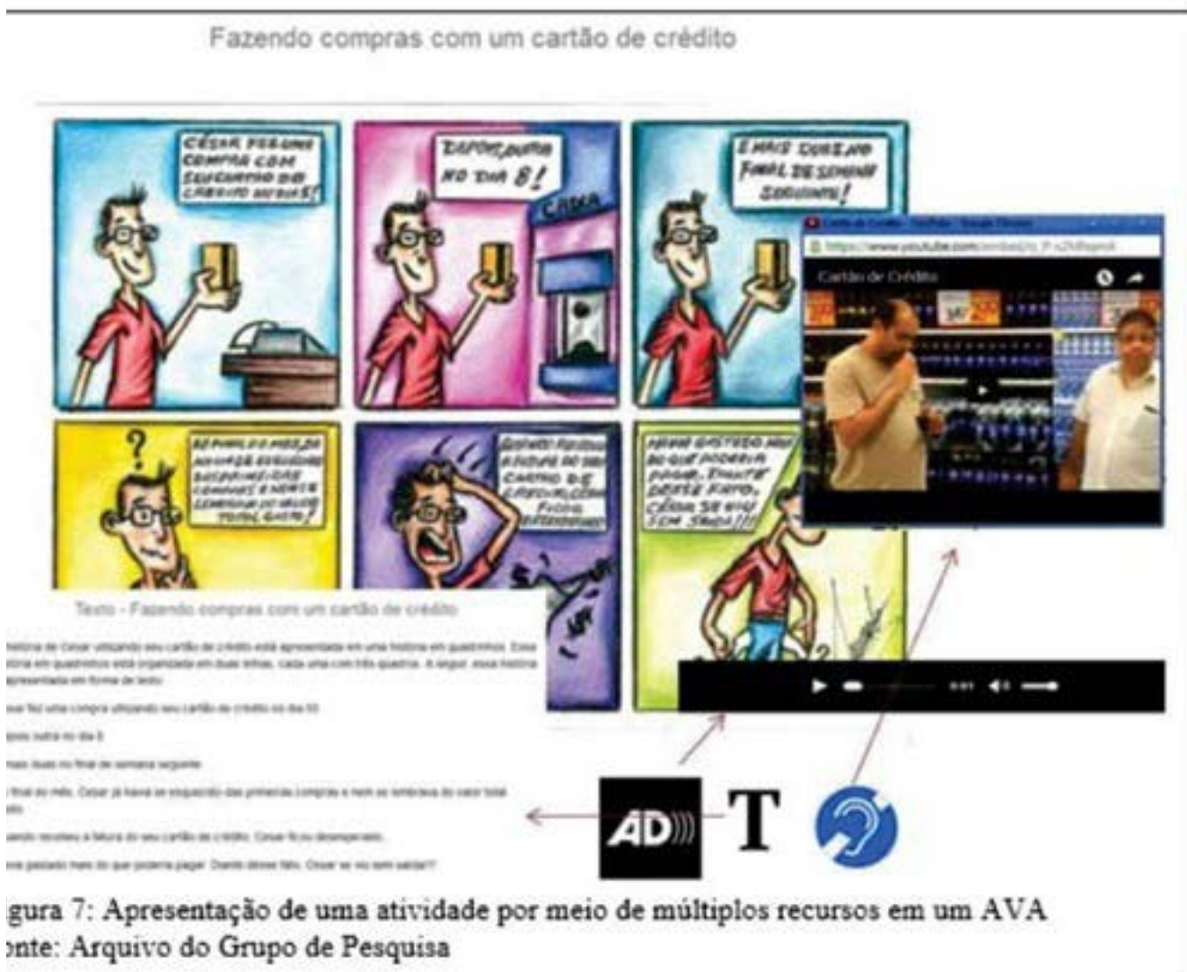
Figura 7: Apresentação de uma atividade por meio de múltiplos recursos em um AVA

princípios e diretrizes do Design Universal, do Design Universal para Aprendizagem e do Design Instrucional para desenvolver cenários inclusivos para cursos oferecidos em ambientes virtuais de aprendizagem (Figura 7). Nossos resultados evidenciam que a EaD, por meio de cursos estruturados com base em cenários que passamos a denominar Cenários para Investigação Inclusivos a Distância, pode também ser acessível a pessoas com limitações sensoriais como modalidade de educação e também pode ser uma alternativa à capacitação profissional de pessoas com deficiência (Santos, 2016).