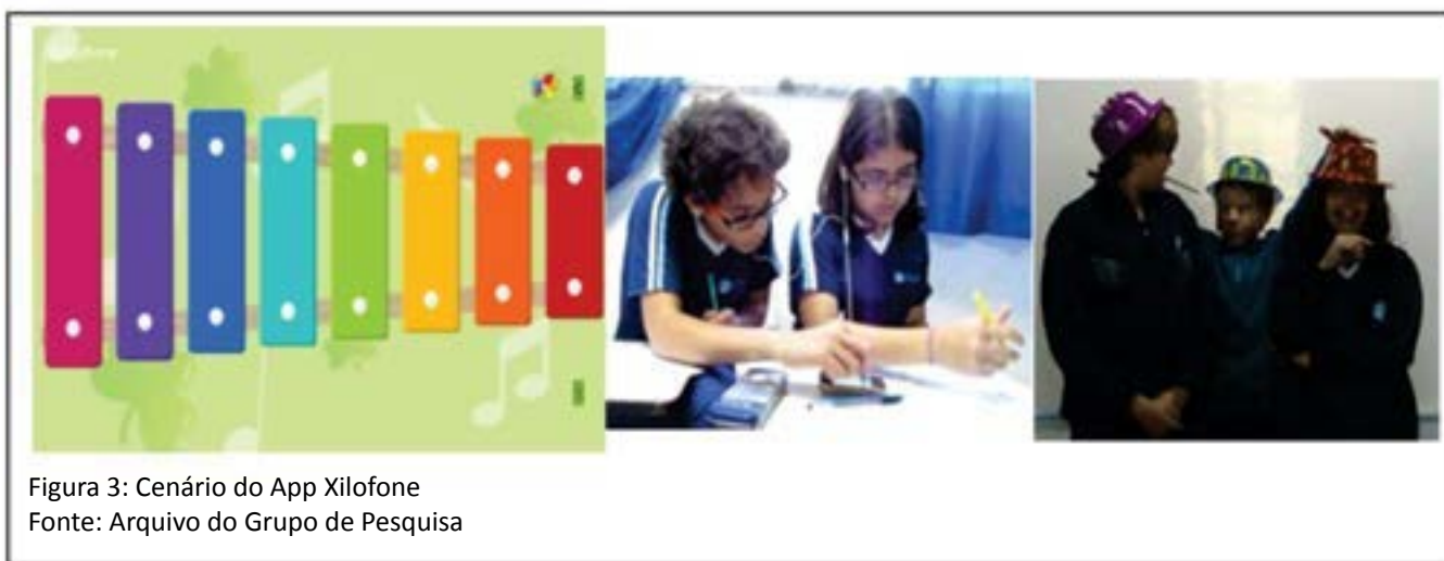
Figura 3: Cenário do App Xilofone

Para compormos esse cenário, associamos as tarefas e outros elementos de cena a ferramentas ainda pouco exploradas em atividades escolares como aplicativos (App) disponibilizados gratuitamente baixados em tablets e smartphones . Neste exemplo, usamos um aplicativo denominado Xilofone (Figura 6) baixado em smartphones ou tablets para trabalhar o Princípio Multiplicativo.