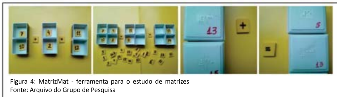
Figura 4: MatrizMat - ferramenta para o estudo de matrizes

Em outra situação, nosso desafio era trabalhar o conceito de matrizes em uma escola pública que tinha alunos cegos e surdos matriculados em classes comuns. A MatrizMat é uma ferramenta material muito simples, composta por caixas plásticas com dimensões aproximadas de 5 cm x 5 cm x 3 cm, imantadas em quatro de suas faces, o que permite que matrizes de qualquer ordem sejam montadas (respeitando-se o limite da quantidade de caixas) (Figura 4). Na versão apresentada aos alunos surdos e aos alunos sem limitações sensoriais, os números são escritos em retângulos de borracha (E.V.A) que são colocados nas células das matrizes, enquanto que, para os alunos cegos, fazemos uso das tampas das caixas, nas quais aplicamos números em Braille (Silva, 2012).